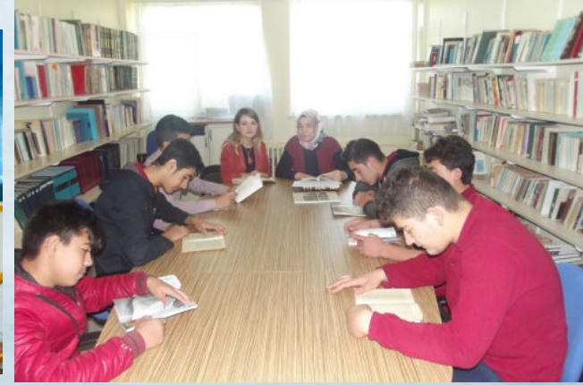
Kitap okuma etkinlikleri