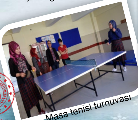
Masa tenisi turnuvası