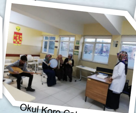
Okul Koro Çalışmaları