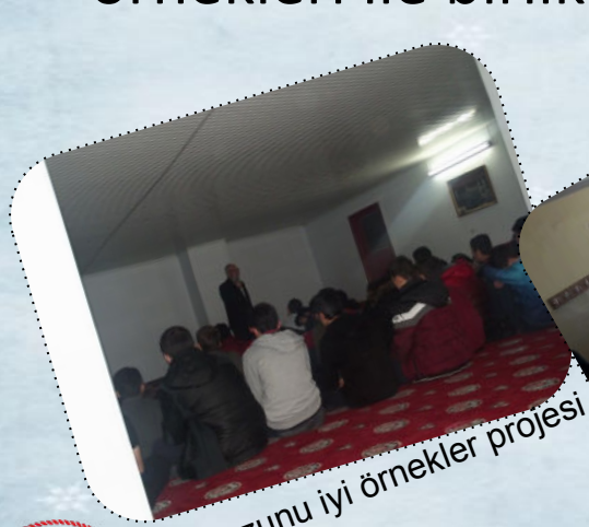
İHL mezunu iyi örnekler projesi

Yönlerini bulma konusunda kendilerine ışık olmaları için iyi örnekleri ile birlikte hareket ediyorlar..