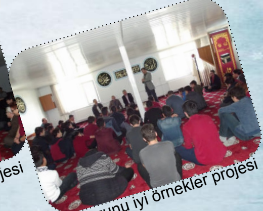
İHL mezunu iyi örnekler projesi