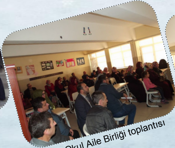
Okul Aile Birliği toplantısı