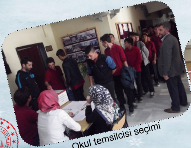
Okul temsilcisi seçimi