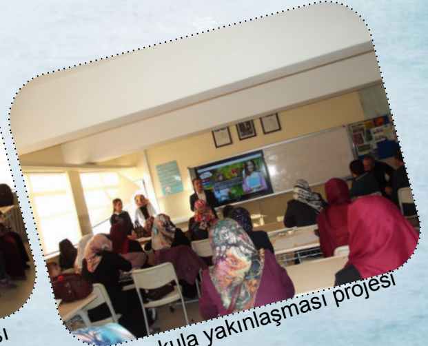
Evin okula yaklaşması projesi