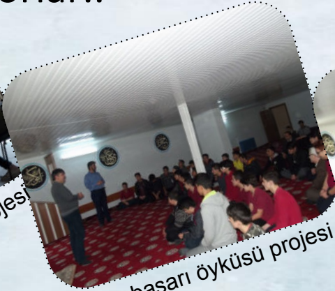
Bir başarı öyküsü projesi