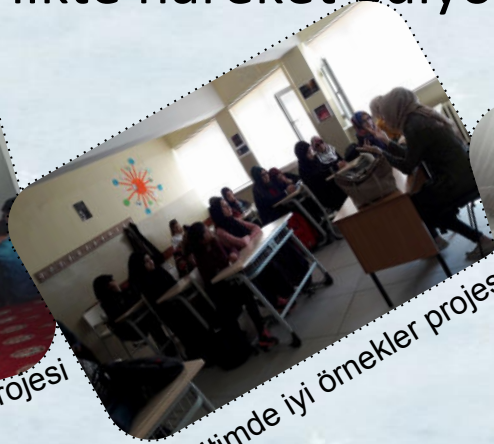
Eğitimde iyi örnekler projesi